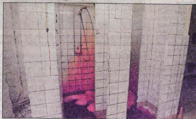
Die Installation „Blutige Duschen“ von Max Kowalewski im Sozialgebäude des Schlachthofes führt die Arbeitssituation sehr drastisch vor Augen.