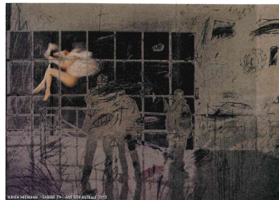
ULRICH HEEMANN: »SABINE 19« AUF DER OSTRALE 2017